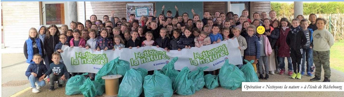
Opération « Nettoyons la nature » à l'école de Richebourg