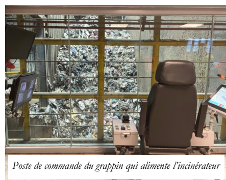
Poste de commande du grappin qui alimente l'incinérateur

Les déchets de tout-venant vont être secoués et lacérés par des griffes hydrauliques qui déchiquettent les sacs plastique et éparpillent leur contenu. Ils seront ensuite acheminés sur des tapis roulant vers la chaudière thermique. Des filtres posés sur les