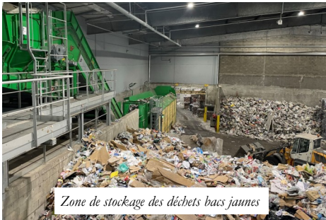
Zone de stockage des déchets bacs jaunes

Les déchets des bacs à couvercle jaune (plastiques, cartons, papiers, boîtes de conserve) sont déversés dans des réservoirs différents. D'abord éparpillés, ils sont ensuite posés par des tractopelles sur des tapis qui les conduisent vers des machines de tri.