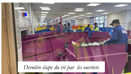
Dernière étape du tri par les ouvriers

C'est grâce à ces ouvriers de la dernière étape du tri que nos erreurs ou nos paresse sont réparées et ne polluent pas le tri final. Ayons une pensée pour ces hommes et ces femmes qui, penchés sur leur tapis roulant font des heures de travail épuisant.