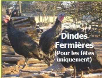
Dindes Fermières (Pour les fêtes uniquement)