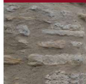
Enduit à pierre vue