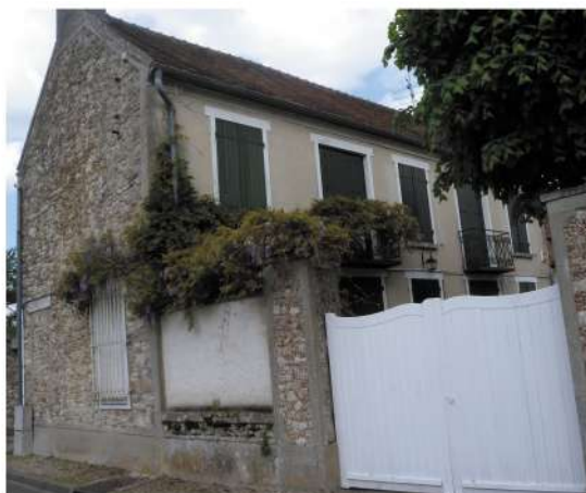
Maisons en pierres : patines des pierres du mur qui contrastent avec l'enduit très clair de l'habitation limitrophe...