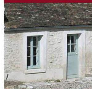
Décors de façade : bandes plates en plâtre (photo prise hors commune)